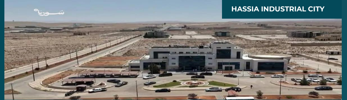
HASSIA INDUSTRIAL CITY